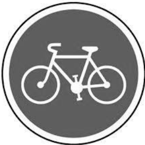
Obligation : Les vélos doivent rouler sur cette voie.