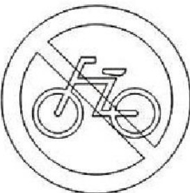
Interdiction : Les vélos n'ont pas le droit de rouler sur cette voie.