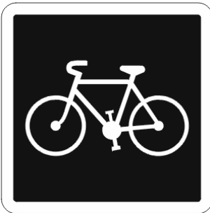
Indication : Les vélos peuvent rouler sur cette voie.