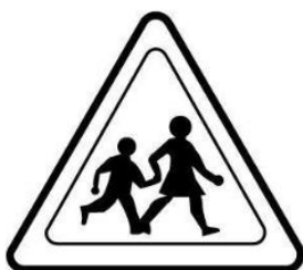
Danger ! Faites attention aux piétons !